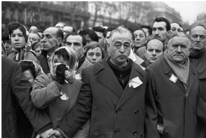
Défilé pour les obsèques du 13 février

L'émotion fut intense. La grève générale lancée le 9 février mobilisa plus de deux millions de participants, fermant les écoles et stoppant les trains. Presse et télévision pourtant sous contrôle d'État se turent. Les obsèques grandioses, le 13 février, rassemblèrent une foule silencieuse de 700 000 à un million de manifestants.