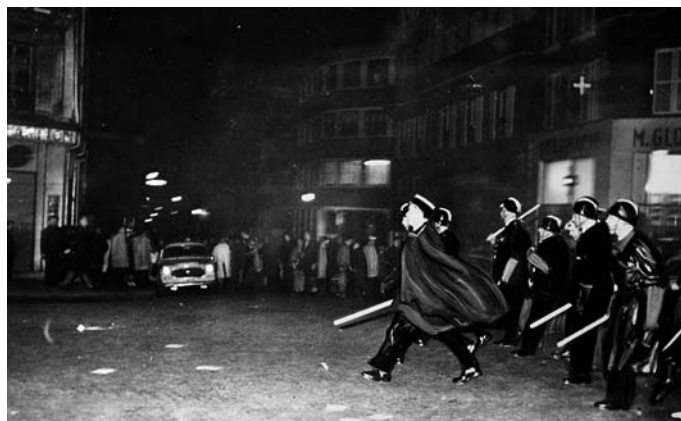
Charonne, 8 février 1962 : comme 5 mois plus tôt, la police parisienne, armée de "bidules", se prépare à tuer...

La répression est d'une sauvagerie terrible. Les brigades spéciales d'intervention, armées de longues