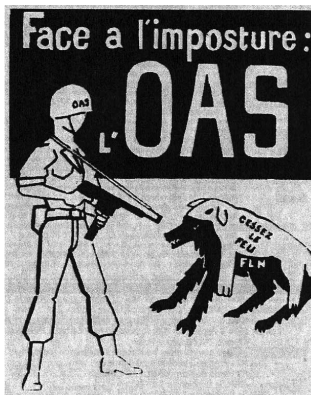
Affichette de l'OAS : le loup "FLN" recouvert de la peau du mouton "Cessez-le-feu".

Le 22 avril 1961, le putsch est déclenché à Alger, mené par les généraux Challe, Jouhaud, Salan et Zeller pour "sauver l'Algérie française". Ils sont appuyés par les colonels Argoud, Godard, Lacheroy. Aucun parfum d'un nouveau 13 mai 1958 ne flotte sur Alger et très vite pour les