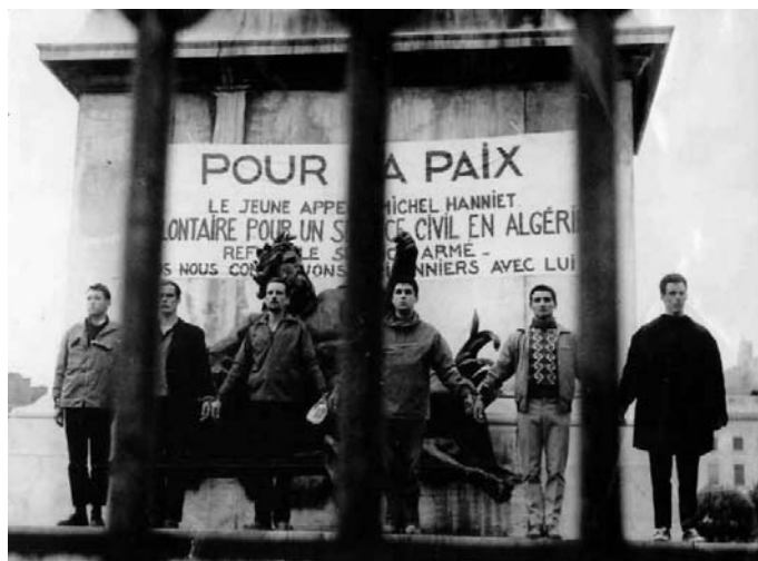
Manifestation de soutien à un insoumis, Lyon, 1961.

raciale et l'inégalité sociale. Luttant pour leur indépendance, ghettoïsés, repérables au faciès, ils sont torturés même en France. Ni charité, ni paternalisme, après 130 ans de colonialisme, la réalité dégradante de cette guerre légitime une pleine solidarité avec un peuple opprimé. Ceux qui s'engagent dans le soutien savent qu'en engageant cette lutte, c'est aussi la liberté en France qu'ils défendent. Cet acte de fraternité pensé, mis en pratique dans les réseaux de soutien est un fil précieux de fraternité par lequel la France a eut une autre face que celle du colonialisme.