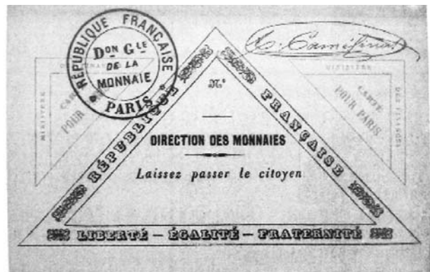
Laisser-passer de la Direction des Monnaies. Un triangle significatif ?