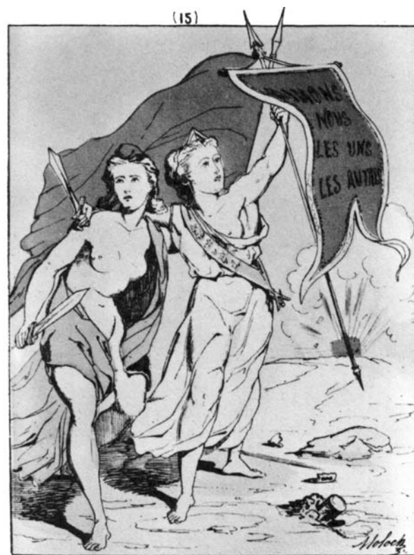
LA FRANC-MAÇONNERIE & LA COMMUNE .

Il est décidé d'envoyer une nouvelle délégation rencontrer Thiers le 22 avril. Celui-ci oppose une fin de non-recevoir catégorique à toutes les requêtes.