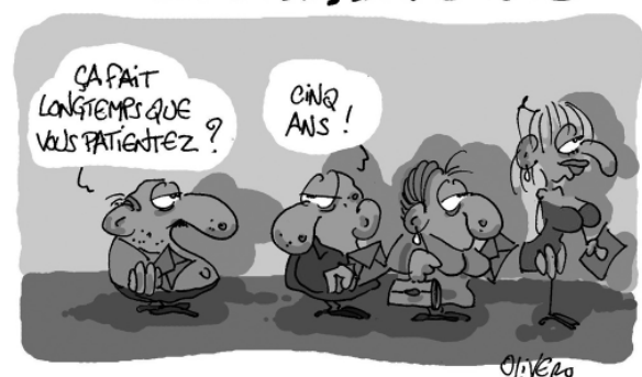
Dessin d'presse d'Oliviero https://blogs.mediapart.fr/ficanas/blog/261015/trop-d-elections-tuent-les-elections