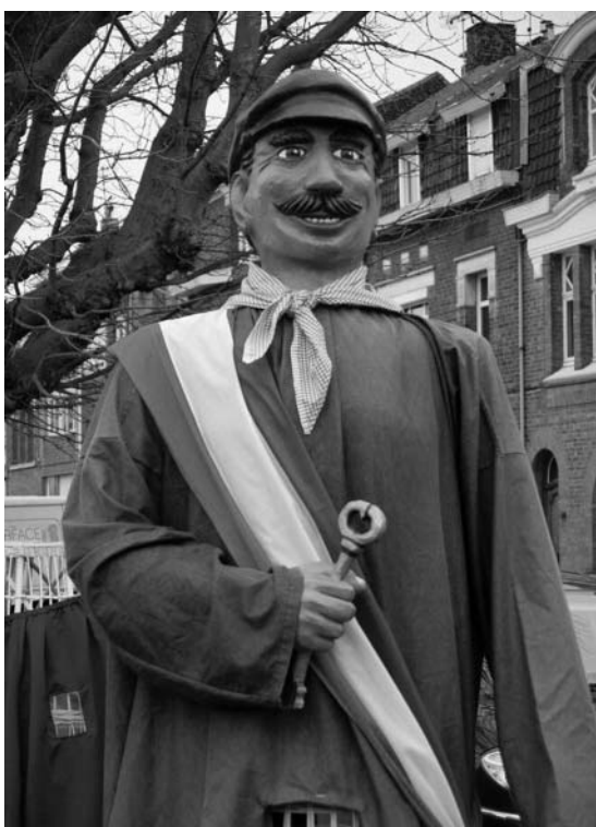
Un maire géant dans la région du Nord.

Citation : « C'est après quinze ans de vie associative qu'une partie de l'équipe de militants arrive, avec d'autres animateurs de la vie locale, aux responsabilités municipales en 2001. Spécialiste en rien, mais aguerrie à s'occuper de tout, la nouvelle équipe municipale est riche d'expériences acquises dans les nombreux domaines de la vie sociale (sport, éducation, solidarité, écologie, économie solidaire, loisirs, culture...). [...] le bilan peut donner à comprendre, à réfléchir, à inspirer, à travers des exemples vivants, la conduite des élus ou des aspirants à la transformation écologique et sociale, au niveau territorial ». (Michel Bourgain, Maire Vert en Banlieue ).