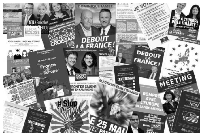
Légende : « Les candidats des groupes parlementaires européens pour présider la Commission sont presque inexistantes sur les tracts de campagne ». Extrait de la page de l'université de Strasbourg http://prod.cuej.u-strasbg.fr/mini-sites/europe2016/index.php?page=character&theme=citoyen