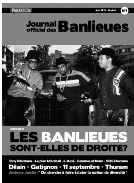
Couverture du n°1 de la revue Journal Officiel des Banlieues